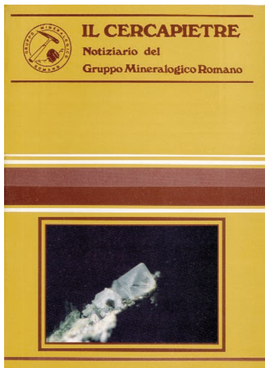
"Il Cercapietre", n.° 16 del 1989

Ad aprile dell'anno 1996, in occasione della VI Settimana della Cultura Scientifica e Tecnologica nell'ambito del Tema " I percorsi della conoscenza ", in collaborazione con il Dipartimento di Scienze della Terra dell'Università degli Studi di Camerino, esce un numero speciale monografico dal titolo Il quarzo: viaggio nella storia alla scoperta del minerale "custode del tempo" ; ma gli impegni di energie ed economie profusi in tale numero impediscono la normale uscita dell'edizione