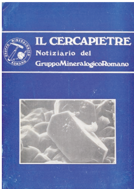
"Il Cercapietre", n. 14 del 1977