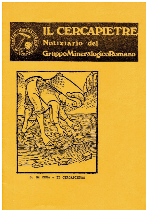
"Il Cercapietre" 1° supplemento al n. 19, marzo 1986