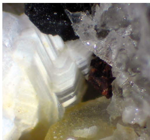
Figg. 1 e 2. Nuova specie IMA N° 2009-84, Valle Bianchella, Sacrofano – RM. Cristalli di 0,8 mm (sopra) e 0,7 mm (sotto). Coll. e foto L. Mattei.

minerali associati vi sono, oltre che magnetite, biotite, sodalite, pirosseno, e granato, anche altre cancriniti in corso di identificazione.